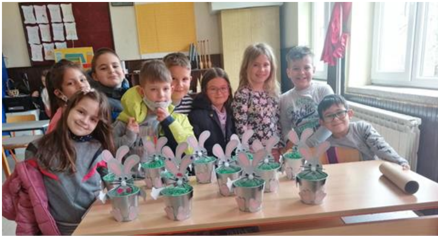
Ponosni učenici OŠ Vuk Karadžić, Stojnik sa svojim radovima.