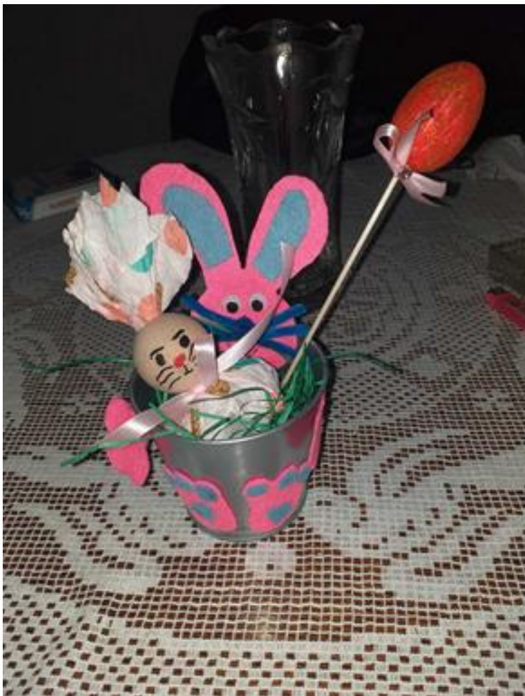
Ukrasne zeka-saksije, mirišljavi zečiči, dekorativno jaje od stiropora. Rad učenika OŠ Vuk Karadžić, Stojnik