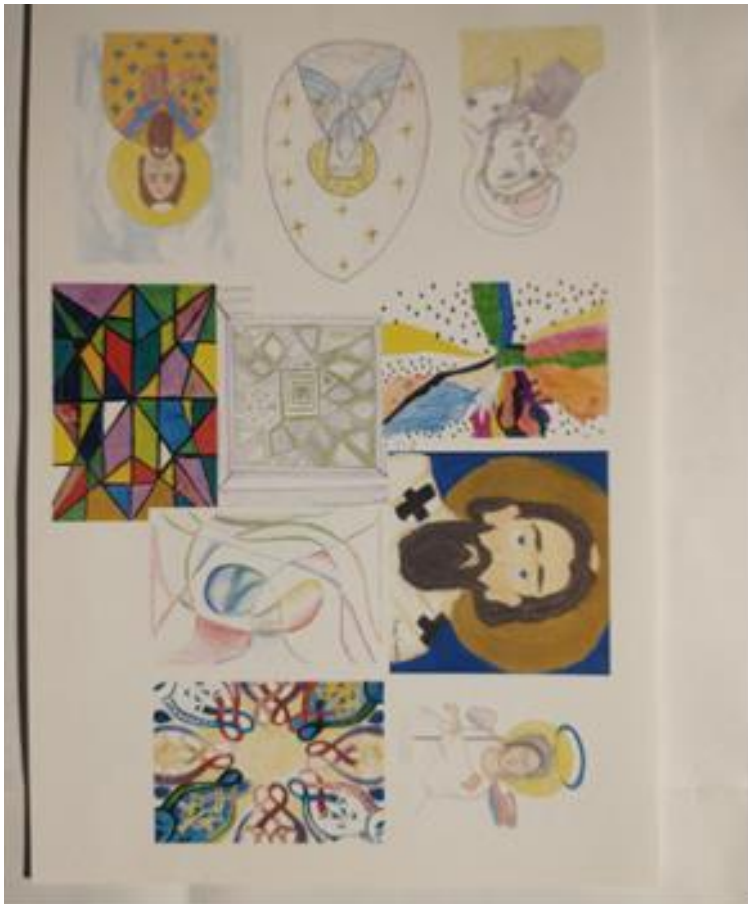
Nalepnice za jaja. Rad učenika OŠ Vuk Karadžić, Stojnik

зеке). Добротворна продаја организована је у „Фортуна“ маркетима. Идеја је била да се заједно са наставницима и ученицима осмисле радови и предмети који задовољавају образовно-васпитне циљеве, али могу и да изађу на тржиште у облику ручно израђених производа који се могу продавати. Добит која се остварује улагаће се у финансирање активности радионице, набавку уџбеника и школског прибора, спортске опреме, наставних средстава, као и на курсеве за професионално усавршавање ученика и особља школе. Поред тога, пројекат има и нетржишне циљеве као што су професионална оријентација, формирање предузетничког духа, стваралаштва, радних навика, одговорности за испуњавање преузетих обавеза у тимском раду. Ово је пилот пројекат, планирано је његово додатно усавршавање и проширивање деловања. На овај начин и међупредметна повезаност, као и сарадња између ученика и наставника.