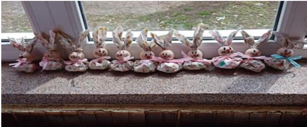
Mirišljavi zečiči. Rad učenika OŠ Vuk Karadžić, Stojnik