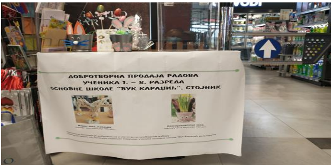
Prodajno mesto Spermarket Fortuna, Stojnik