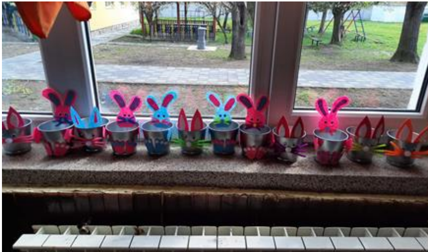
Ukrasne zeka-saksije. Rad učenika OŠ Vuk Karadžić, Stojnik